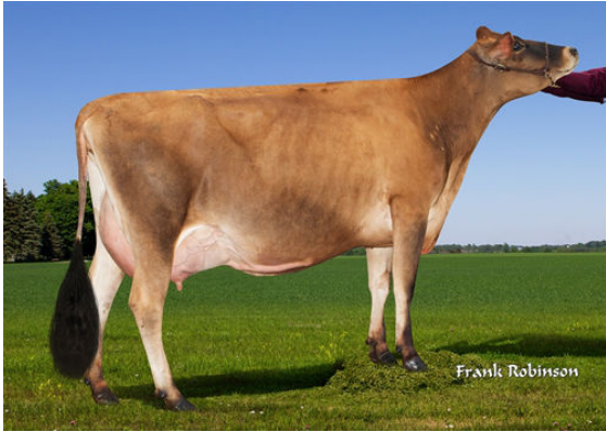
JX PROGENESIS CINDERELLA {6} DAM