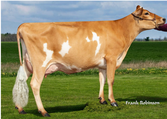
PROGENESIS CRAZE CORD {6} GRANDDAM